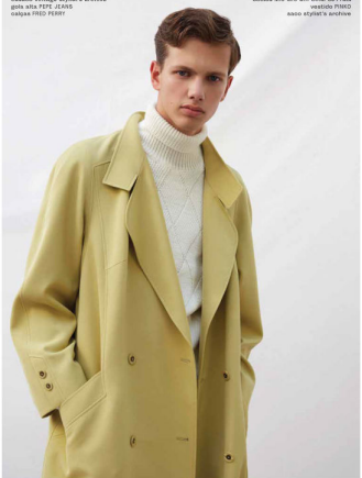
BRUNO casaco: MIZ SUU com Offroad Puma vestido: PRIMO sapato: STONE'S ISLAND