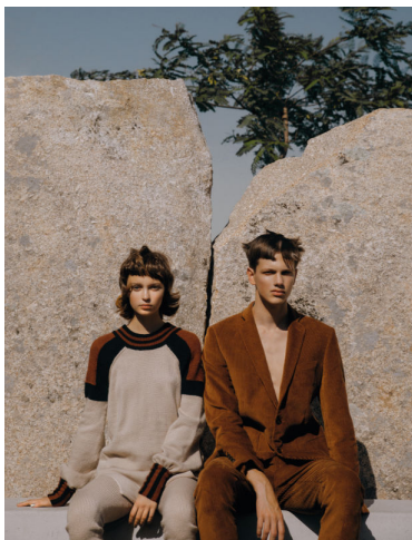
LUCAS camiseta: vintage KITH v. ankara gola: PATE JEANS calças: PATE JEANS