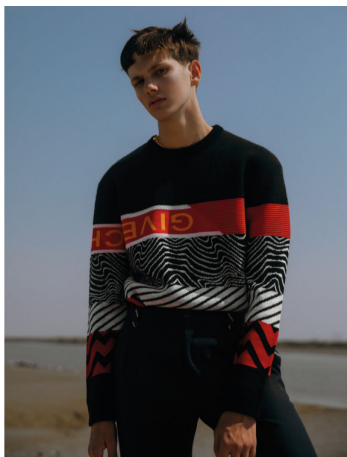
Camiseta em malha de algodão: ELI SAO. BLENCHY no flannel: C&A. Calças em: B. MYOUL. No pulgão em feltro: SAKOOR. Botas em couro de vaca: ELI SAO. No terno: colômbia: amonho. A produção: BILCOO em metal: L. CO. CELINE. No terno: BILCOO em metal: L. CO. CELINE.